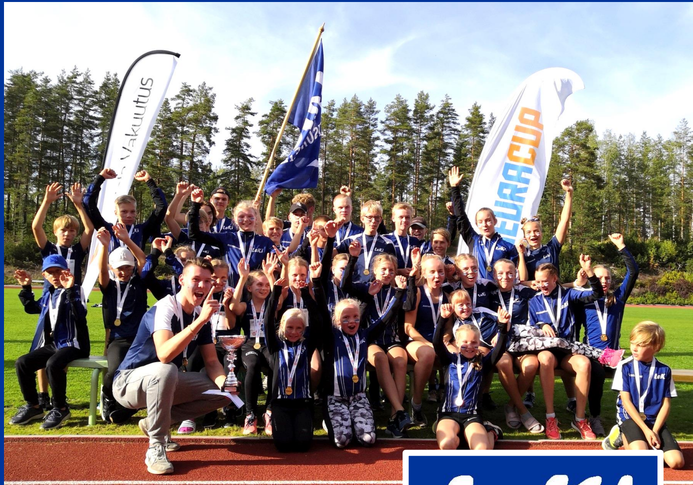
Seuracup 2019 voittajajoukkue